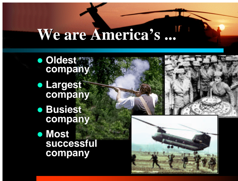
Figure 2. Extraits de “Introduction to the United States Department of Defense”

... if you look at us in business terms, many would say we are not only America's largest company, but its busiest and most successful ...[US DoD, 2000] 20